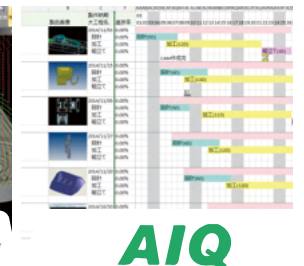
AIQ( 工程管理ソフト )